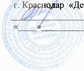
ГРАФИК аттестации педагогических работников МБДОУ МО г. Краснодар «Детский сад № 79» в 2023 - 2024 учебном году